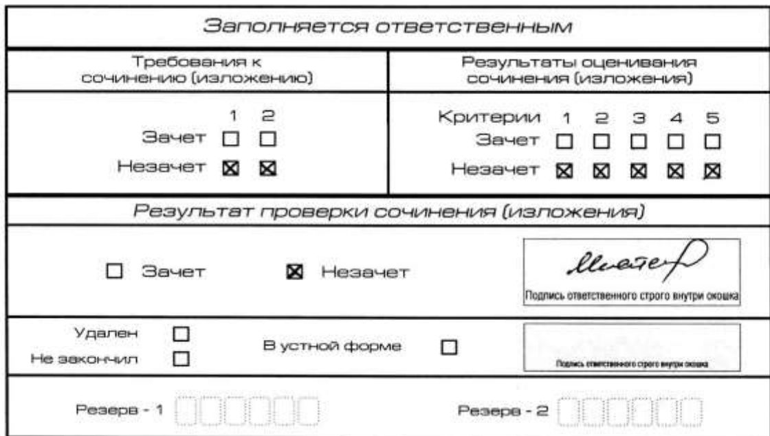
Рис. 6. Область для оценки работы